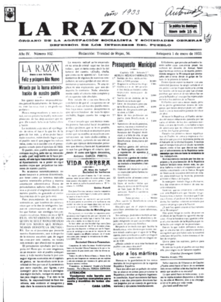
Portada del periódico La Razón . Órgano de la Agrupación Socialista y Sociedad Obrera. Defensor de los intereses del pueblo, correspondiente al 1 de enero de 1933, Editado por la Casa del Pueblo a partir de 1933 312

Una última referencia relativa a la Casa del Pueblo se encuentra relacionada con la prensa obrera de aquellos momentos, pudiéndose decir, que aparte de publicaciones como El Socialista , de tirada nacional, fueron difundidos otros periódicos de carácter local, tales como La Razón , iniciado en 1930 y editado oficialmente desde la Casa del Pueblo desde 1933, que emitía una tirada de unos 1.500 ejemplares. Otro periódico fue el llamado Renovación , anunciado como “la revista de los jóvenes socialistas”.