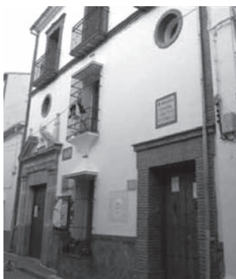
Edificio dedicado a Biblioteca, Archivo y Centro de Mayores, construido tras el derribo de la Casa del Pueblo (Año 2010)