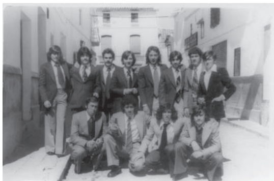
Fotografía tomada “el día de la talla de 1976”. A la derecha de la imagen aparece la fachada de la Casa del Pueblo, dedicada en aquel entonces a Cámara Agraria. La puerta daba acceso al salón de la casa