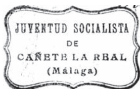
Juventud Socialista de Cañete La Real