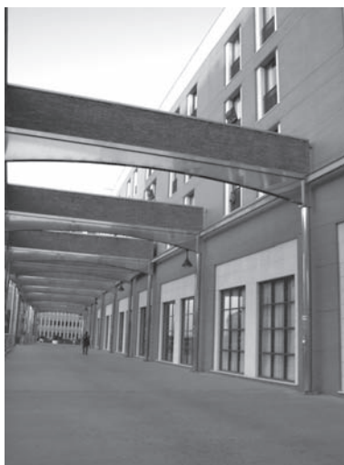
Edificio levantado donde estuvo la Casa del Pueblo de Málaga. C/ Pasillo de Santo Domingo (Año 2010)