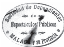
Sello de los Sociedad de Dependientes de Espectáculos Públicos