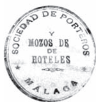
Sello de la Sociedad de Porteros y Mozos de Hoteles de Málaga