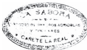
“La Sabora” Sociedad de Obreros Agrícolas y Similares