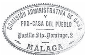
Sello de la Casa del Pueblo