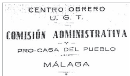
Membrete del Centro Obrero UGT de Málaga

La Casa del Pueblo de Málaga estuvo ubicada en la calle Pasillo de Santo Domingo, número 2. No se conoce la fecha de su adquisición pero sí que pertenecía a UGT, como refieren varios de los documentos 319 que se han encontrado de las distintas Sociedades que existieron en Málaga durante la época de la República. Por ejemplo,