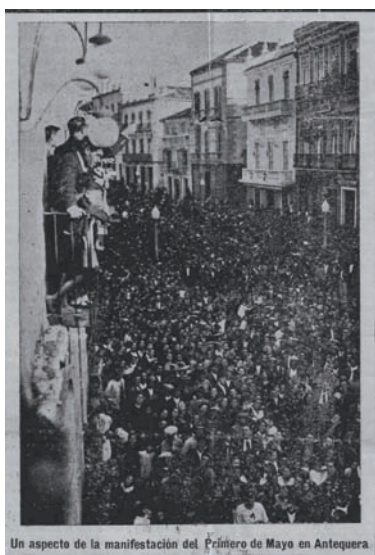
Un aspecto de la manifestación del Primero de Mayo en Antequera.

Respecto a las actividades realizadas por las Sociedades Obreras, Agrupación Socialista y Juventudes Socialistas, fueron múltiples y numerosas durante los años de la República, todas ellas encaminadas a la consecución de mejoras en las bases de trabajo y la solución de problemas tales como la falta de empleo o la elevada tasa de analfabetismo. Por ello, tal y como se cita en el Boletín de UGT de mayo de 1933, durante el funcionamiento de la Casa del Pueblo no cesaron de organizarse actos de propaganda para orientar a los trabajadores y lograr sus fines.