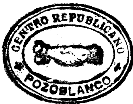
Sello del Centro Republicano de Pozoblanco, en noviembre de 1931