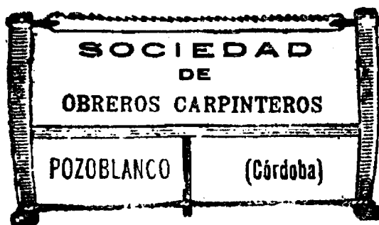
Sello de la Sociedad de Obreros Carpinteros, utilizado en 1932 y 1933