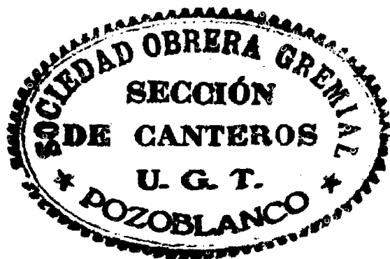
Sello de la Sección de Canteros de la Sociedad Obrera Gremial, con las siglas de la U.G.T utilizado en junio de 1933