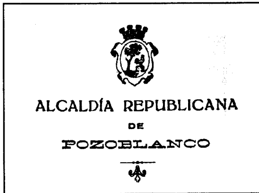
Membrete de la Alcaldía Republicana de Pozoblanco