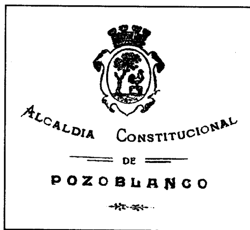
Sellos y membrete de la Alcaldía Constitucional de Pozoblanco utilizados hasta 3 de septiembre de 1931