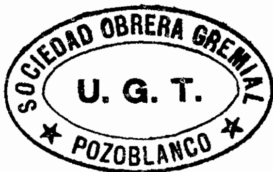
Sello de la Sociedad Obrera Gremial con las siglas de la U.G.T., utilizado a partir de 1933