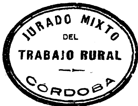
Sello del Jurado Mixto del Trabajo Rural, a partir de febrero de 1933