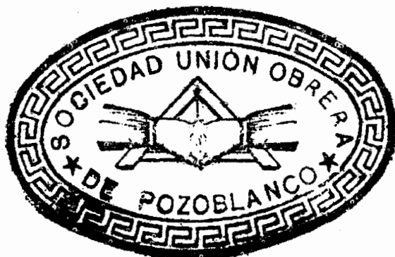
Sello de la Sociedad Unión Obrera, utilizado en 1906