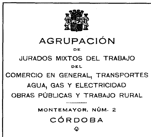
Membrete de la Agrupación de Jurados Mixtos del Trabajo del Comercio en General, Transportes, Agua, Gas y Electricidad, Obras Públicas y Trabajo Rural, de Córdoba, 1933