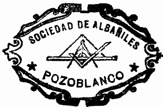
Sello de la Sociedad de Albañiles, utilizado en los años 1931 y 1932