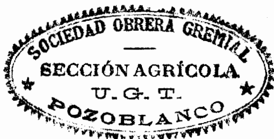
Sello de la Sección Agrícola de la Sociedad Obrera Gremial con las siglas de la U.G.T.