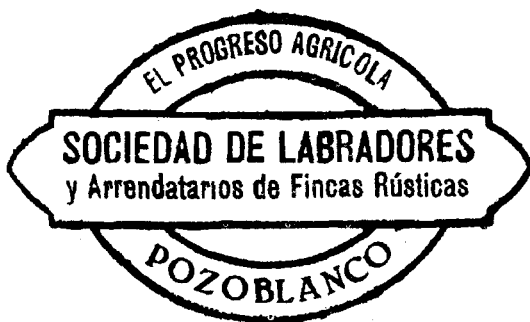
Sello de la Sociedad de Labradores y Arrendatarios de Fincas Rústicas 'El Progreso Agrícola', utilizado en noviembre de 1931