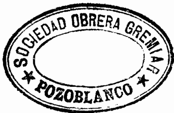
Sello de la Sociedad Obrera Gremial de Pozoblanco, usado de 1918 a 1932