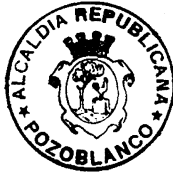
Sello de la Alcaldía Republicana de Pozoblanco, a partir de 1932