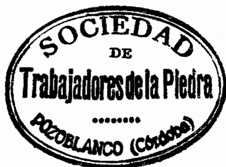
Sello de la Sociedad de Trabajadores de la Piedra , usado en 1933